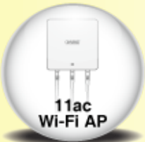
11ac Wi-Fi AP