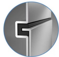
Sealed Lock-and-Key Design

Na zadní straně je k dispozici celá řada portů, mezi nimiž vyčnívá především rozhraní HDMI 2.0 , které zajistí snadné promítání 4K obsahu při vyšším jas a kontrastu oproti standardnímu rozlišení. Jas je klíčem k viditelnosti. I proto nabízí projektor BenQ LU9245 funkci dynamického tlumení jasu dle scény a optimalizuje světelný výkon a kontrast pro co nejlepší obraz.